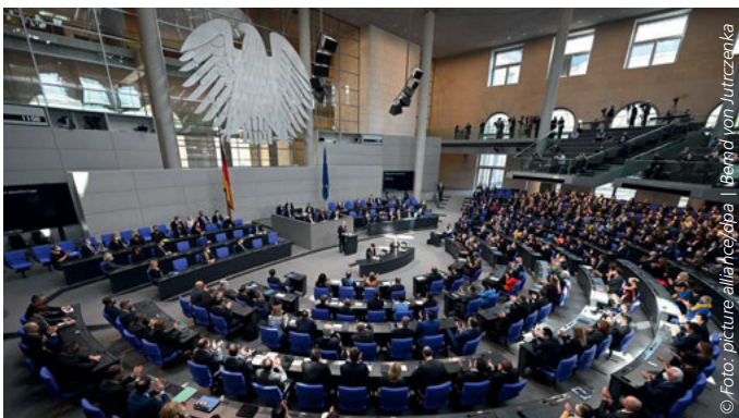
Der Plenarsaal, in dem die Sitzungen des Bundestags stattfinden.

Internetredaktion der LpB BW: Aufgaben des Bundestages. In: bundestagswahl-bw.de vom 04.2021 ( https://www.bundestagswahl-bw.de/bundestag-aufgaben#c31666 – Zugriff vom 12.1.2022)