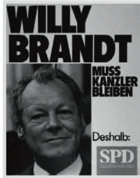
— Abb. 2: Wahlplakat 1972: Regierung wiederwählen