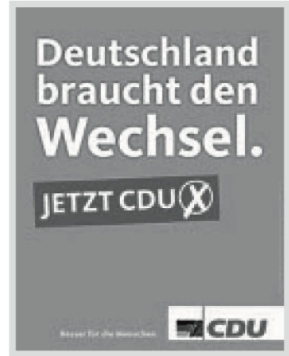
— Abb. 3: Wahlplakat 2005: Wechsel wählen