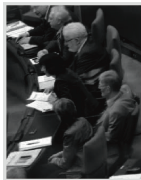
— Abb. 4: Abgeordnete im Bundestag: Der Frauenanteil beträgt kaum ein Drittel.