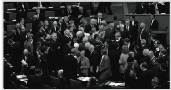
— Abb. 1: Namentliche Abstimmung im Bundestag über ein Gesetz.

E. _____ Eine hohe Wahlbeteiligung zeigt, dass die Bürger Vertrauen in die demokratischen Institutionen haben. Werden demokratische Wahlen und ihre Ergebnisse in der Bevölkerung akzeptiert, können gesellschaftliche Konflikte friedlich ausgetragen werden, ohne die Stabilität des politischen Systems zu gefährden. Abbildung Nr.: